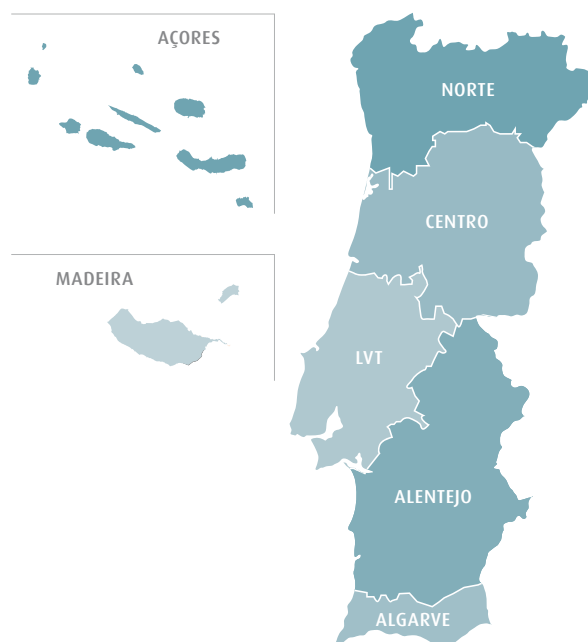
Figura 1: ↓ Regiões portuguesas

As regiões foram caracterizadas como urbanas, semi-urbanas e rurais, de acordo com as freguesias da área de residência das crianças participantes no estudo COSI. Segundo os critérios de classificação territorial estabelecidos pelo Instituto Nacional de Estatística, a tipologias da área municipal das freguesias estabelece-se da seguinte forma: